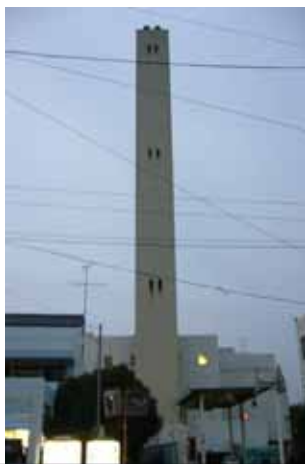
国分寺市ごみ処理施設

10年後の新焼却場建設が話題となっています。小金井市は、国分寺市に建設候補地（案）を示すことで、来年4月からも安定した可燃ごみの処理ができます。今後、新焼却場所に関しての市民参加による検討会が開かれ、建設場所は平成21年2月ごろ最終決定されます。現在、小金井市は可燃ごみ焼却について、他市町村の支援や国分寺市との共同処理に向け最大限の努力をしています。